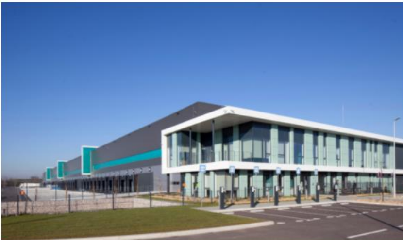
Plate-forme de 34 000 m 2 développée dans le cadre d'un clef-en-main locatif, à proximité des axes autoroutiers irriguant la région Rhône-Alpes – PUSIGNAN (69) .

Développement d'une plateforme logistique de 33.500 m 2 au sein du pôle logistique de Sénart : TIGERY (91) .